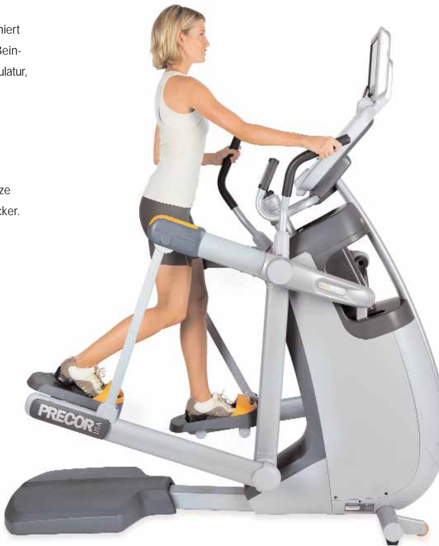
STRIDE GUIDE (Schrittanzeige) – 0 bis 69 cm

Ähnlich wie beim schnellen Laufen, aber bei deutlich geringerer Belastung, trainieren lange Schritte die gesamte Beinmuskulatur.