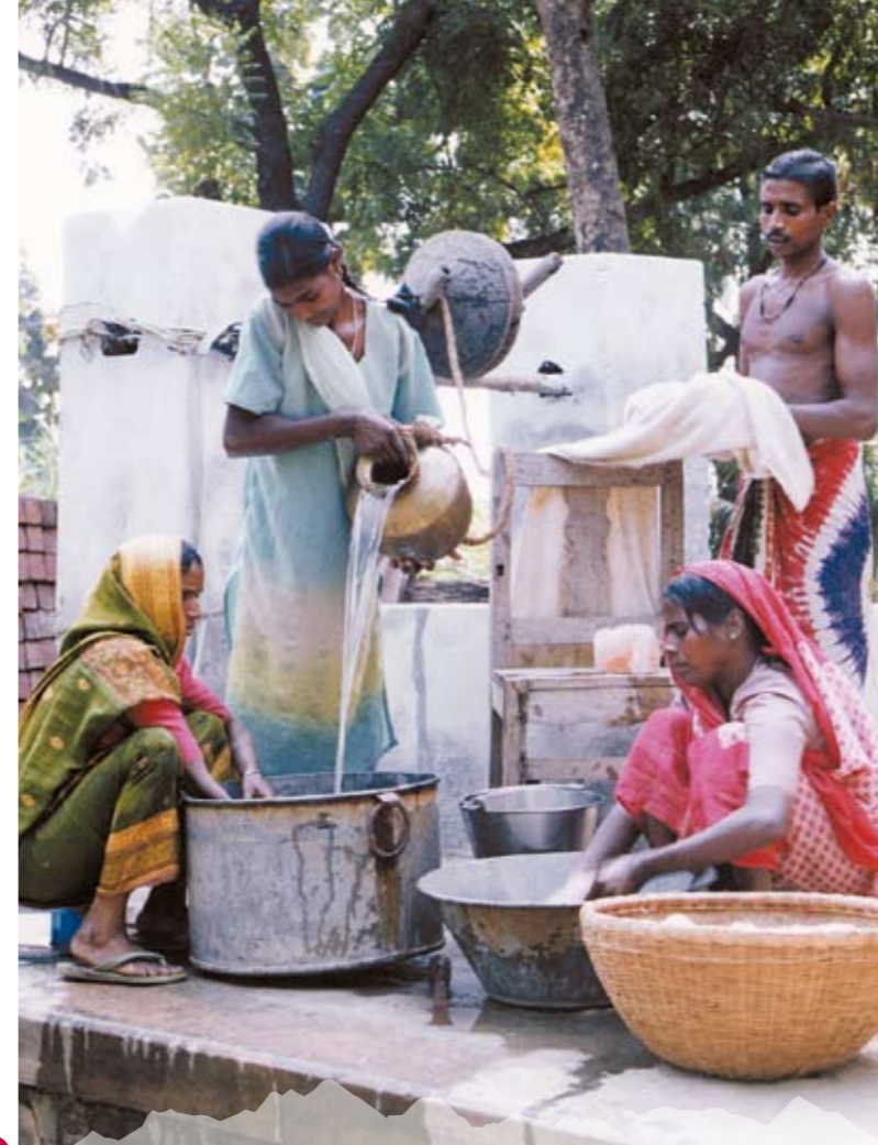
Die Salzbrocken werden mit frischem Quellwasser gereinigt.

Mit dem VitaSal® Kristallsalz verwenden Sie ein Produkt von hoher Qualität. Dafür garantiert dieses Aromalife Gütesiegel. Ersichtlich ist die Ursprungsbezeichnung, die Chargennummer und das Haltbarkeitsdatum. Somit kann immer zurückverfolgt werden, von wo das Salz stammt, wann es abgepackt wurde und wie die jeweilige Analyse des Salzes aussieht.