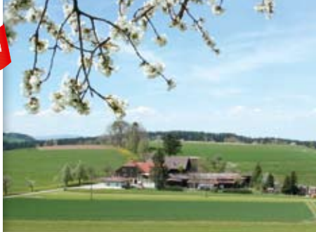
Image à droite: La menuiserie familiale Nyfeler à l'Emmental, centre de production de cuboro et cugolino.

From well-managed forests www.fsc.org Cert no. FSC-COC-1833/E © 1996 Forest Stewardship Council